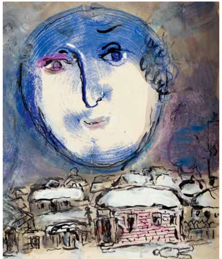
8. Marc Chagall, Lune-Visage vers 1968 Gouache, pastel, crayon de couleur et encre de chine sur essai de gravure 25,7 x 21,5 cm Collection particulière © ADAGP, Paris, 2018