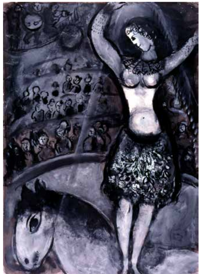
3. Marc Chagall, L'écuyère , 1955 Lavis d'encre de chine, lavis de gouache sur papier 105 x 75 cm, Collection particulière